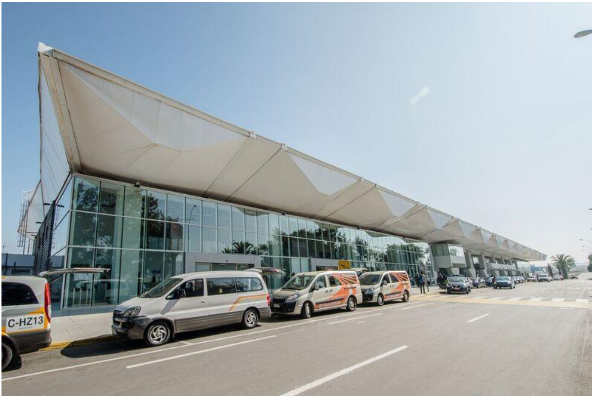
Aeropuerto Cerro Moreno de Antofagasta // II Región // Chile